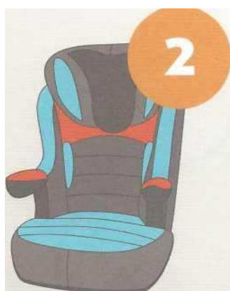
15-25 кг от 3 до 7 лет