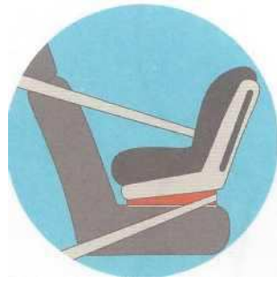
Лицом против движения