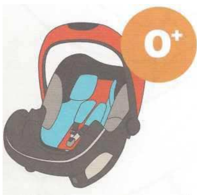
0-13 кг от рождения до 1 года

Покупайте кресло вместе с ребенком. Пусть он попробует посидеть в нем - прямо в магазине.