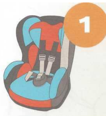
9-18 кг от 9 месяцев до 4 лет