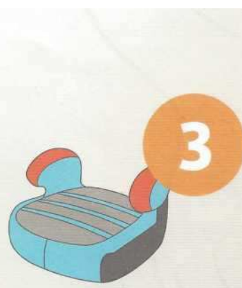
22-36 кг от 6 до 12 лет