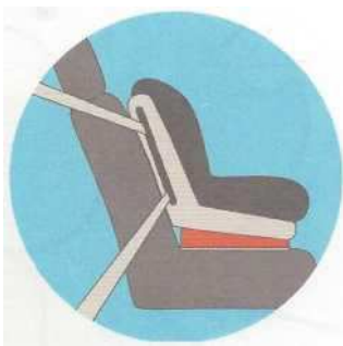
Лицом по ходу движения

Самое безопасное место для установки детского кресла в автомобиле — среднее место на заднем сиденье. Самое небезопасное - переднее пассажирское сиденье. Туда автокресло ставится в крайнем случае, при обязательно отключенной подушке безопасности.